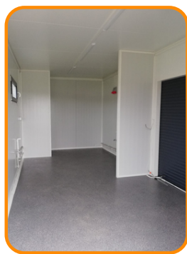
WYDZIELONE POMIESZCZENIA Z DRZWIAMI